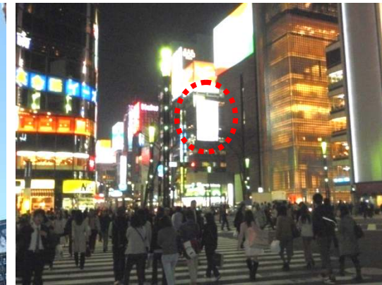
夜の数寄屋橋交差点から