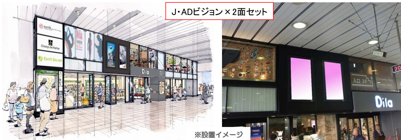
J・ADビジョン×2面セット