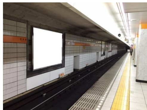
※掲出イメージです。

● 申込 (2015/8月～10月掲出分)：2015/6/29 10：00～随時受付開始