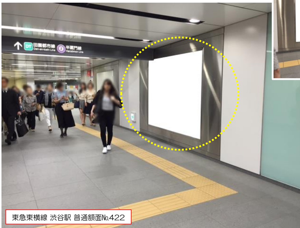
東急東横線 渋谷駅 普通額面No.422