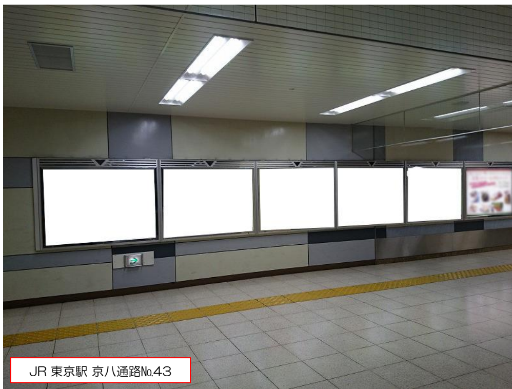
JR 東京駅 京八通路No.4-3