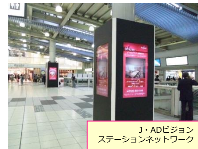
J・ADビジョン ステーションネットワーク