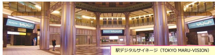
駅デジタルサイネージ (TOKYO MARU-VISION)