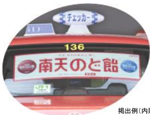
掲出例(内貼りです)