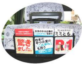
掲出例(ケースイメージ) ※広告ケースは3枠・4枠混在となります。