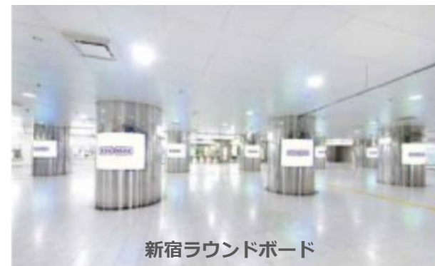
新宿ラウンドボード

《備考》 ※フィルム掲出の場合はアクリルの内側面に掲出しておりますが、内照光源消灯によるアクリルへの映り込みを配慮して、アクリルの外側面に両面テープを使用して掲出いたします。