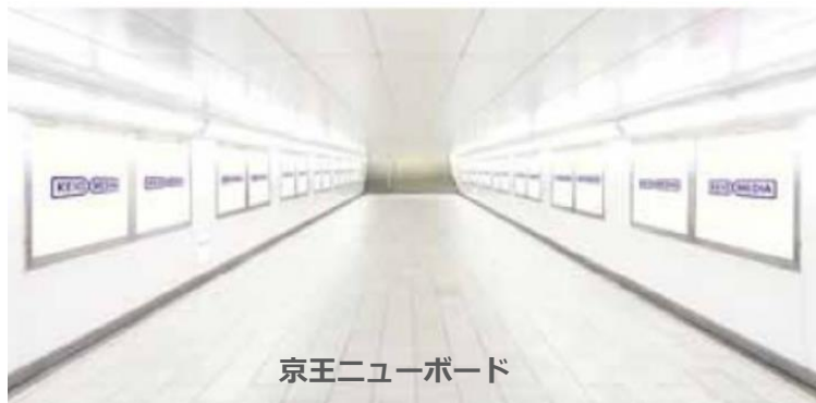
京王ニューボード