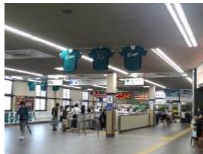
高田馬場駅フラッグ