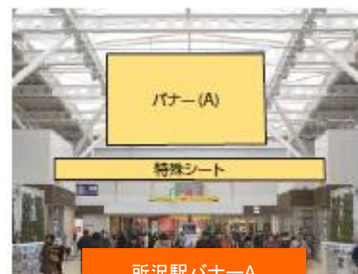
所沢駅バナーA 行先表示器裏シート