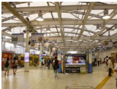
西武新宿駅フラッグ