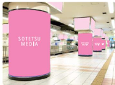
柱巻広告 (2F中央ホーム)