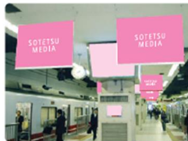
横浜フラッグ (2Fコンコース 2・3番ホーム)