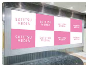
スーパーボード(2F 3番線ホーム)