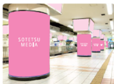
柱巻広告 (2F中央ホーム)