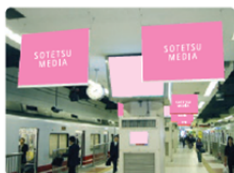
横浜フラッグ (2Fコンコース 2-3番ホーム)