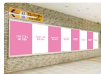
ハマセットボードI&II(1番線ホーム)