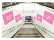
相鉄線・横浜駅(2階～1階)