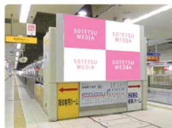
トップボード(2F改札内コンコース)