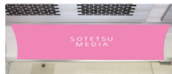
ワイドインターサイズ