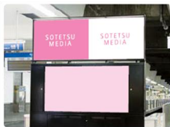
トップボードII(2F改札内コンコース)