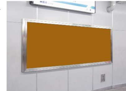
中づくりポスター