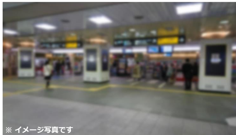
※ イメージ写真です