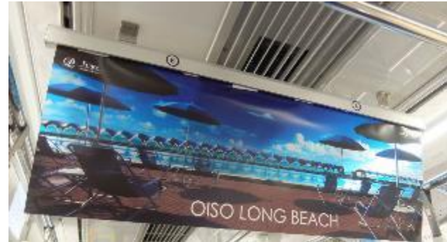
▲フィルム素材（中づり）