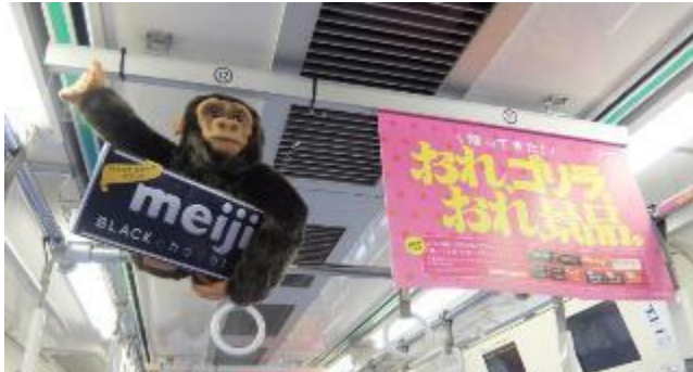
▲ぬいぐるみ（広告貸切）