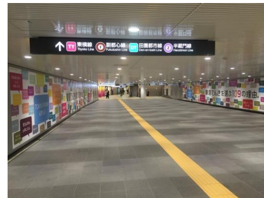
*参考：道玄坂ハッピーボード