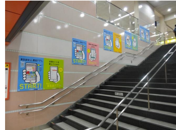
*参考：横浜駅臨時集中ばり