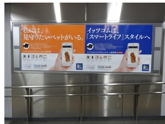
* 参考：東横線渋谷駅一般駅ばり

※既にお申込みを頂いている案件は、企画の対象外となります。 ※特殊加工・形状及び、申請が必要な案件は対象外となります。 ※他キャンペーン・割引企画との併用はできません。