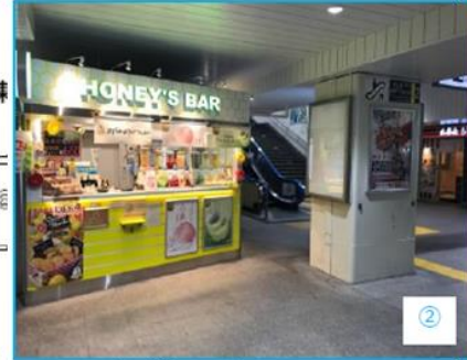
本屋改札内No.50 現場写真