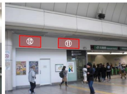
▲橋上本屋(中央南改札内)