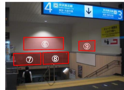
▲橋上本屋(中央南改札内)