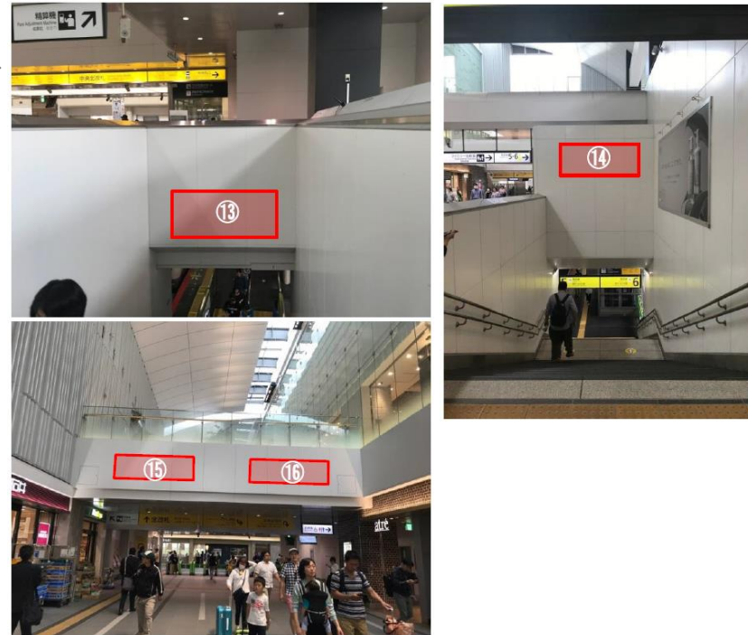
▲北口コンコース(中央北改札・北改札/内)