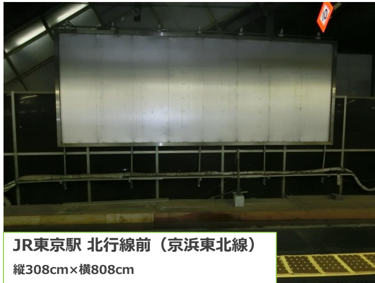
JR東京駅 北行線前（京浜東北線） 縦308cm×横808cm

東京駅北行線側と北通路の大型サインボードをセットで販売いたします。 短期利用と長期利用で2種類の販売プランを用意しました！巨大ターミナル駅の超大型ボード、是非ご提案ください。 ※北通路の箇所は2020年度以降工事の予定がございます。