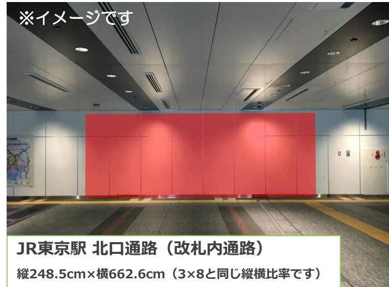
JR東京駅 北口通路（改札内通路） 縦248.5cm×横662.6cm（3×8と同じ縦横比率です）