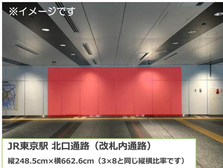
JR東京駅 北口通路 (改札内通路)