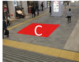
掲出イメージ(新宿新南口改札外トリオ)