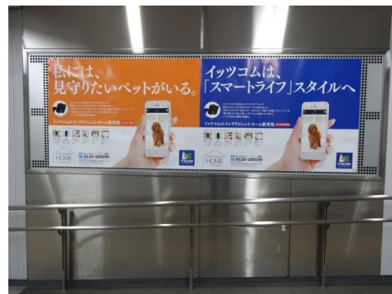
*参考：東横線渋谷駅一般駅ばり

※既にお申込みを頂いている案件は、企画の対象外となります。 ※特殊加工・形状及び、申請が必要な案件は対象外となります。 ※他キャンペーン・割引企画との併用はできません。