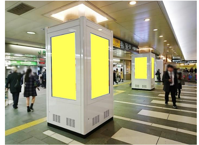
TOQサイネージピラー目黒駅

※既にお申込みを頂いている案件は、企画の対象外となります。 ※他キャンペーン・割引企画との併用はできません。