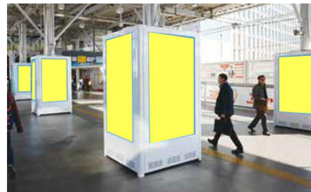
T O Qサイネージピラー二子玉川駅

※既にお申込みを頂いている案件は、企画の対象外となります。 ※他キャンペーン・割引企画との併用はできません。